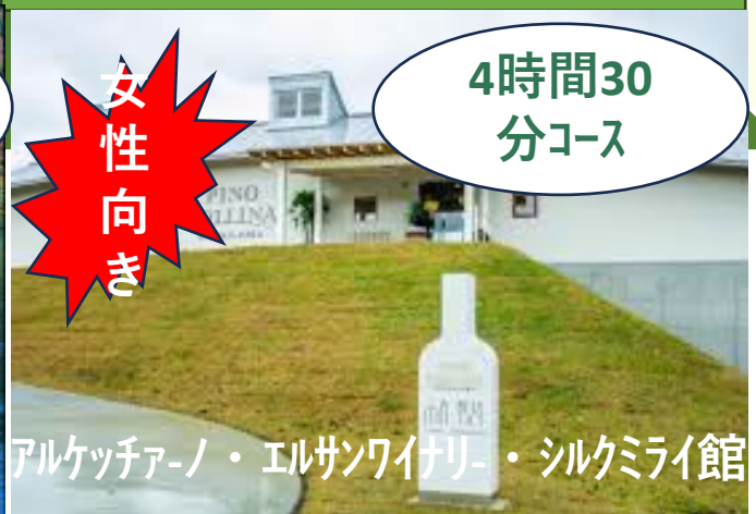
アルケツァーノ・エルサソワイリ・シルクミライ館

乗車場所 = カトリック教会 = エルサソワイリ = シルクミライ館 = アルケツァーノ = 降車場所