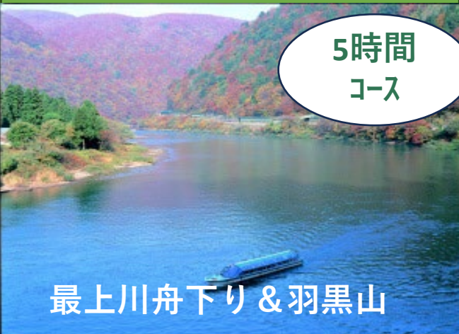
最上川舟下り & 羽黒山