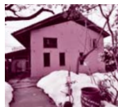
蔵屋敷 LUNA (昼食)

古い趣のある蔵屋敷、美しい食器に盛られた地元の旬料理、食と空間をゆっくり楽しめます。 ②月曜日