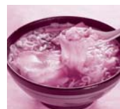
酒田ラーメン(満月)

羽黒・月山・湯殿山の総称。通称歴史薫る山伏と信仰のふるさと。 ☆羽黒山の杉並木は「ミシュラン・グリーンガイド・ジャポン」で三つ星で紹介されています。